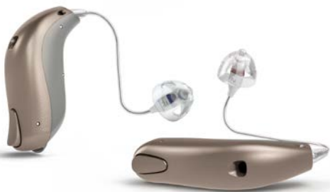
miniRITE Bernafon Zerena